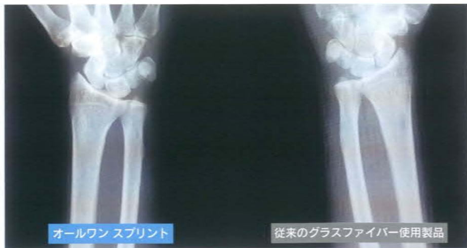
オールワンスプリント