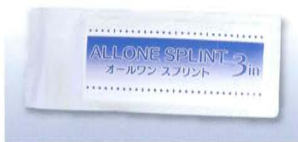
オールワンスプリント カット(クロス・グラス)タイプ

あらかじめ便利な長さにカットされ個別包装された、袋から取り出してそのまま使用出来るタイプのスプリントです。