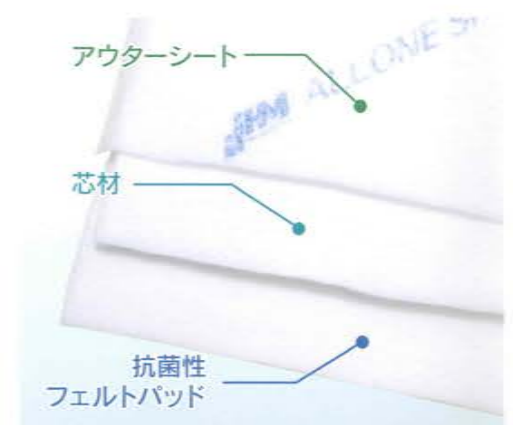
▲シート構造説明図