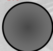
グラスファイバー製品