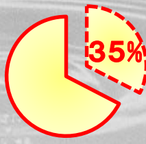
オールワンスプリントクロスタイプライト

クロスタイプ ライトは業界最軽量を実現することで、患者様のQOLの向上を考えたシーネです。